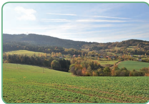
Pahorkatiny – zvlněná krajina s nízkými pahorky a mělkými údolími.