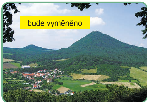
Vrchoviny jsou tvořeny vrchy s příkrými svahy oddělenými hlubšími údolími.