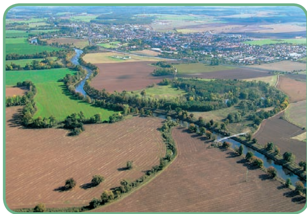
Roviny mají plochý, mírně zvlněný povrch, malé výškové rozdíly.