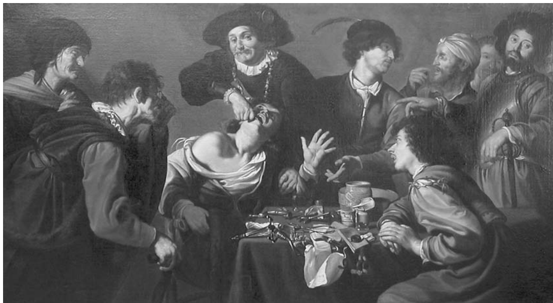
Vyobrazení lékaře ze 17. stol.

Co znamená pojem Latinská Amerika a kde se nalézá? Zjisti v jiných zdro- jích, kde leží Lima a čím je významná.