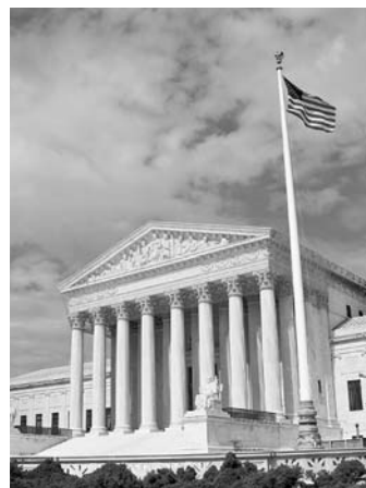
moc soudní Nejvyšší soud

Státní moc v USA byla rozdělena na ..... na sobě nezávislé části. Zákony přijímal ..... Vládu vykonával ..... a ..... Konečné slovo v soudních sporech měl ..... Zamysli se, proč bylo důležité, aby všechny části státní moci nemohl řídit jeden člověk či jedna instituce. .... Zjisti, zda v USA platí toto schéma rozdělení státní moci dodnes.