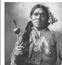
Indián z kmene Arapahů

Domorodí obyvatelé Ameriky čelili přílivu technicky mnohem vyspělejších bílých přistěhovalců. Území indiánských kmenů se postupně zmenšovalo, přičemž spory o půdu mívaly nezřídka ozbrojenou podobu. V dnešní době žije část původních obyvatel USA ve městech (kde se přizpůsobili životu ostatních Američanů) a část v tzv. indiánských rezervacích . Ty zauímají přes 2 % území USA.