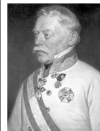
Jan Josef Václav Radecký z Radče, rakouský vojevodce českého původu

V severní Itálii potlačil v roce 1849 ve věku svých 83 let národní hnutí za sjednocení Itálie, a uhájil tak severoitalské provincie pro habsburskou monarchii.