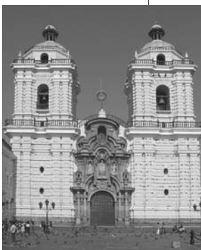
Klášter sv. Františka v Limě

S rozšiřováním kolo- niálního panství se ve světě šířil i ba- rokní sloh a v kolo- niích získával svou osobitou podobu. Rozmanité barokní stavby se proto vy- skytují též v Latinské Americe či v Asii (například v Indii nebo na Filipínách).