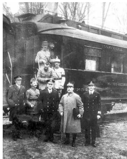
Železniční vagon francouzského maršála Focha [foše], ve kterém podepsali zástupci Německa a Francie příměří, jímž skončila první světová válka.

Jaké problémy museli řešit obyvatelé Českých Budějovic v roce 1918?