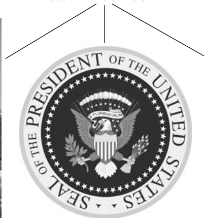
moc výkonná prezident a federální vláda