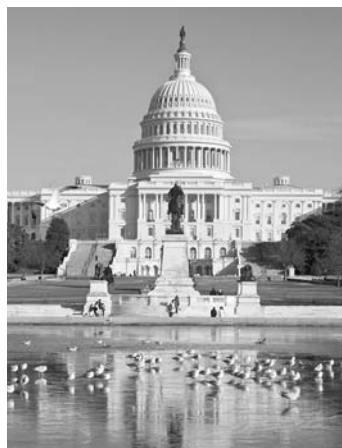
moc zákonodárná Kongres