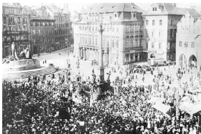
Mariánský sloup na Staroměstském náměstí v Praze