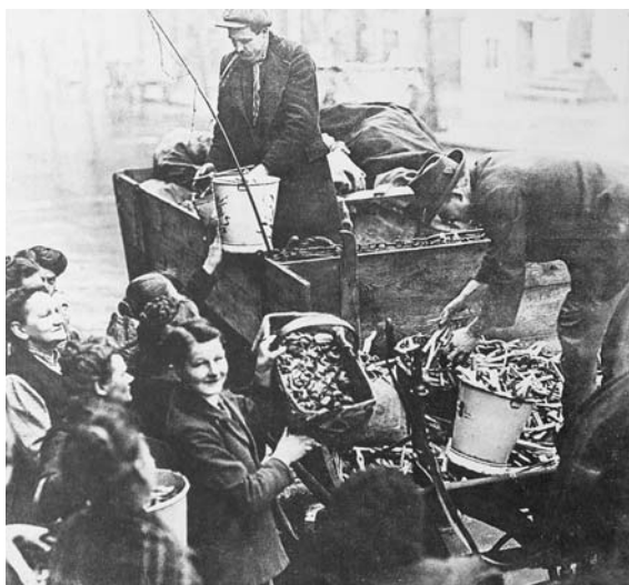
Fronta na bramborovou nať v Německu r. 1917