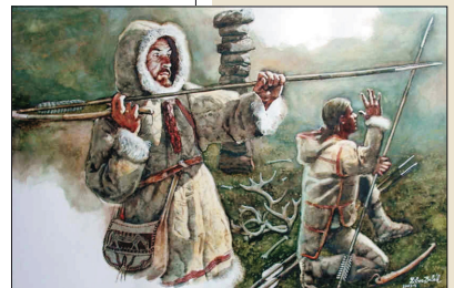
Lovec je připraven hodit oštěp pomocí vrahače. Podle současných poznatků namaloval Libor Balák.

Porovnejte dva následující obrázky a rozhodněte: Ve kterém případě lovec znásobuje svou sílu pomocí páky? Která ze zbraní umožňuje lovcům postupně nahromadit a pak ji ve velmi krátkém okamžiku uvolnit?