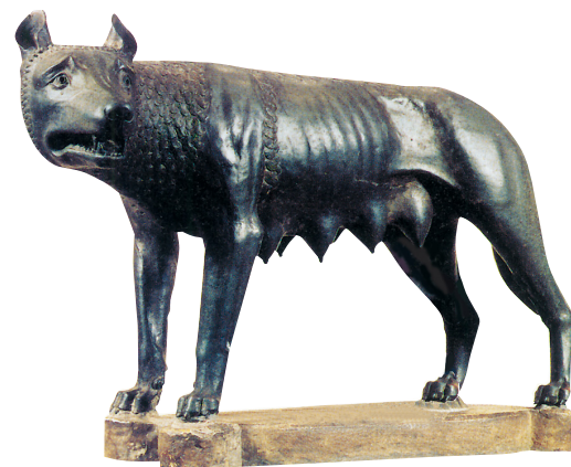
Etruská bronzová socha vlčice se stala symbolem města Řím.

(Upraveno podle textu řeckého spisovatele Plútarcha.)