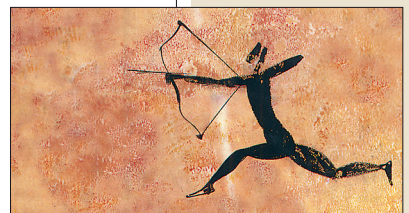
Lovec připravený vystřelit z luku šíp, pravěká malba

Podle obrázků popište použití obou loveckých zbraní.