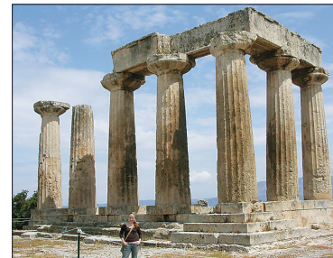
Chrám v Korintu

To jsou slova básně Dosti nás od Svatopluka Čecha (1846–1908) . Verše vznikly v době, kdy se český národ snažil obnovit svou sílu a více se prosadit v Evropě i ve světě. Mnozí lidé však nevěřili, že by malé národy mohly něco velkého dokázat. Ale Čech znal dějiny a vyhledal v nich příklady, že to možné je.