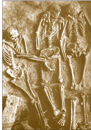
V hrobě v Dolních Věstonicích byla pohřbena asi dvacetiletá žena a po jejích bocích o něco mladší muži. Jejich hlavy byly posypány červeným barvivem. Důvod archeologové neznají. Zemřelým byly vloženy do hrobu milodary v podobě ozdobných předmětů z mamutoviny a zvířecích zubů.

S Co je čepel? Vyhledejte na obrázku pilku a hrot šípu. Rozlište čepel a škrabadlo. Který z předmětů byl součástí dálkové zbraně? Která zbraň to byla? M 017 Kde leží Dolní Věstonice? Jak byla pojmenována soška ženy, kterou ve Věstonicích archeologové objevili? Proč asi pravěcí lovci uctívali ženu-matku? Co znamenají slova milodary a mamutovina ? S Ověřte svá tvrzení. Ze kterých pravděpodobných důvodů byly do hrobů vkládány milodary? Vyhledejte figurky koně, mamuta, medvěda, lvice a hlavu nosorožce. Podle čeho vytvářeli pravěcí lidé podoby zvířat? Které ze zobrazených zvířat vyhynulo?