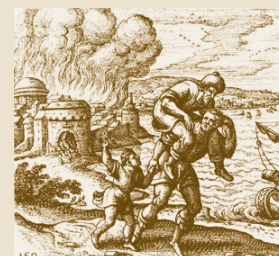
Aeneův útěk z Troje

Proč lidé u nás i jinde ve světě odvodňují bažiny?