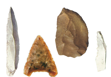
Lidé se naučili z kamene odštěpovat dlouhé čepel. Vyráběli kamenná škrabadla, pilky, hroty k šípům i jiné nástroje.

Anatomicky moderní lidé, kteří v Evropě nahradili neandertálce, vyráběli různé čepelové nástroje. Pohřbívali své mrtvé. Jejich život provázelo též umění. Vytvářeli jeskynní malby, rytiny, sošky zvířat a také tzv. venuše.