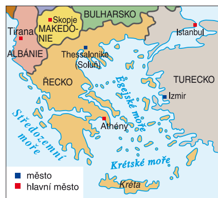
Současné Řecko a jeho sousedé

Řekové položili základy dnešní evropské kultury. Jak si sami říkali? Nejvlivnějšími městskými státy ve starověkém Řecku byly Sparta a Athény . Vyhledejte je na mapce. Patří jejich území i do současného Řecka?