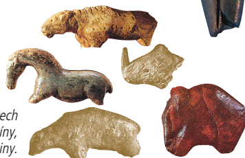
V Dolních Věstonicích i na jiných místech byly objeveny figurky zvířat z pálené hlíny, případně vyřezané z kostí a mamutoviny.