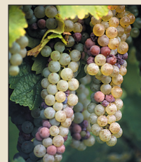
Tradiční plodinou Řeka je dodnes vinná réva. Je vhodná do svažitého a prosluněného terénu.

Ženy v domácnosti vyráběly látky potřebné na oděvy a k zařízení domácnosti. Najděte, které ze žen váží vlnu, drží vlnu na přeslici a z vřetena vytahují nit, na tkalcovském stavu tkají z nití látku, skládají kusy hotové tkaniny. Která zvířata museli Řekové chovat, aby získali potřebnou vlnu?