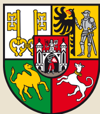
Znak města Plzeň

Zjistěte, co vypráví pověst o založení vaší obce nebo města v blízkém okolí.