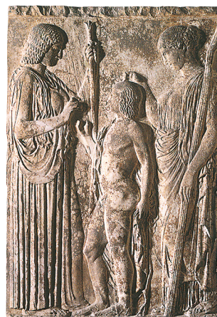
Démétér a Koré

Reliéf nás zavádí k počátkům zemědělství v Řecku. Bohyně Démétér a Koré projevují lásku k lidem. Předávají jim drahocenný dar, první klasy obilí. Proč považovali Řekové obilí za vzácný dar? S Co je to podsvětí ? Kdo mu vládá? V jakém příbuzenském vztahu byli Zeus a Hádés? Kolik měsíců žila Persefoné se svou matkou, kolik v podsvětí? Který jev si tímto mýtem Řekové vysvětlovali?