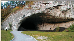
Jeskyně Kůlna byla obývána již v pravěku.