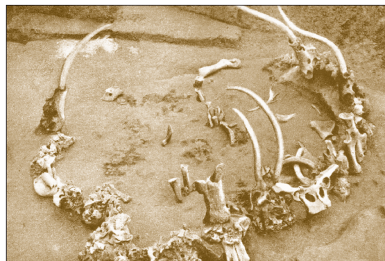
Částečná rekonstrukce pravěkého přístřešku z území Ruska. Podobně mohla vypadat nejstarší obydlí i v našich zemích.

M 017 Vyhledejte Přezletice. Z čeho mohli obyvatelé stavět stěny přístřešku? Čím ho mohli přikrýt? Proč nemožou archeologové spolehlivě zjistit, zda vůbec byla obydlí kryta? S Co znamená slovo rekonstrukce?