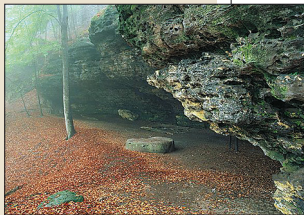
Skalní převis v Českém ráji

Pravěcí lovci nacházeli úkryty také pod skalními převisy a v jeskyních.