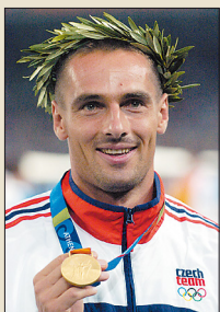
Olympijský vítěz Roman Šebrle

Olivovník se pozná podle sukovitého kmenu a stříbrných listů. Plody se sklí- zejí na podzim. Víte, co se z oliv vyrábí? Tento produkt slou- žil nejen k přípravě jídel. Používal se na svícení, do voňavek i k ochraně pokožky.