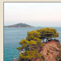
Borovice, lat. Pinus

Borovice rostou i v obtížných podmínkách. Borovici lesní se také říká sosna.