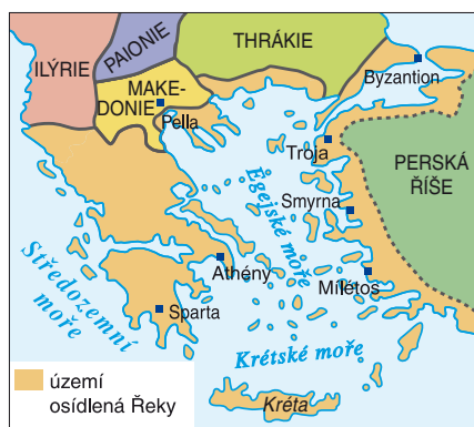
Oblast starověkého Řecka

Starověké Řecko zahrnovalo asi 200 malých států vytvořených kolem významných měst. Říkáme jim proto městské státy , řecky polis (mn. č. poleis). Většinou si vzájemně pomáhaly a spolupracovaly. Někdy mezi sebou válčily. Vždy je ale spojovaly stejný jazyk, obyčej a víra v bohy sídlící na Olympu. Současné Řecko je jednotným státem s hlavním městem a jedinou vládou. Řecky Elliniki demokratia , česky Helénská republika .