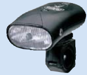
das Vorderlicht přední světlo

klika pedál převodník přední vidlice odrazové světlo brzdová čelist přední brzda přední světlo brzdové lanko brzdová páka řídítka nástavce na řídítka zvonek přesmykač; přehazovačka volnoběžka