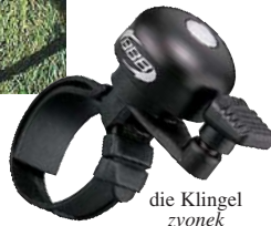
die Klingel zvonek