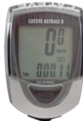
der Fahrradcomputer cyklopočítač