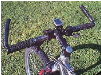
der Lenkeraufsatz nástavec na řídítka