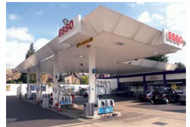
petrol station benzinová pumpa

petrol station podst. ( brit. ) (petrol stations) benzinová pumpa