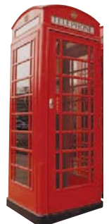
phone box telefonní budka

phone box podst. ( brit. ) (phone boxes) telefonní budka