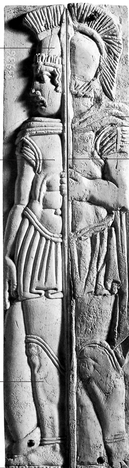
Římský voják, reliéf z 1. pol. 3. stol. př. n. l.

Hannibal jako osmiletý chlapec složil přísahu svému otci, že bude až do smrti nepřítelem Římanů. Ve svých jednadvačeti letech se stal vrchním velitelem kartaginské jízdy, a slib proto dodržel.