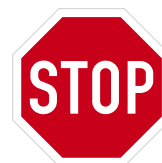
Stůj, dej přednost v jízdě.

Zde musíme dát přednost, ale nemusíme zastavit.