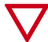
Dej přednost v jízdě

Tato značka mi říká, že jsem na hlavní silnici.