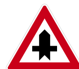
Křižovatka s vedlejší silnicí

Tato značka mi říká, že jsem na hlavní silnici.