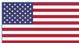
The United States of America