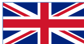
The United Kingdom of Great Britain and Northern Ireland