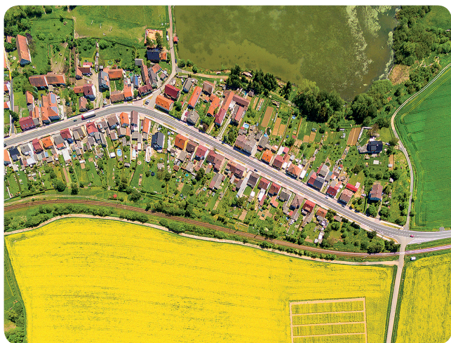
Lužany (ulicová vesnice)

V plánu obce vyznačte nejnovější zástavbu. Zjistěte, jak byla půda, kde dnes stojí nové domy, využívána dříve. Patří váš dům mezi starší zástavbu, nebo mezi novější?