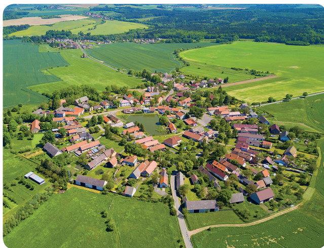
Lipnice (okrouhlá vesnice)