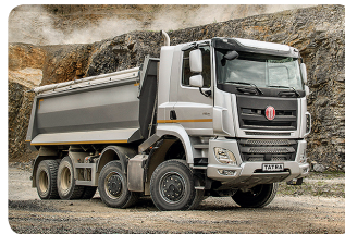
Nákladní auta značky Tatra se vyrábí v Kopřivnici.