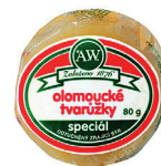
Olomoucké tvarůžky z Loštic