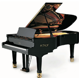
Klavíry značky Petrof se vyrábí v Hradci Králové.