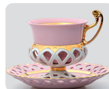
Tradiční růžový porcelán z Karlových Varů