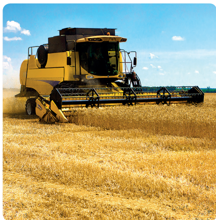
Získávání materiálů a surovin (zemědělství, rybolov, těžba a lesnictví)