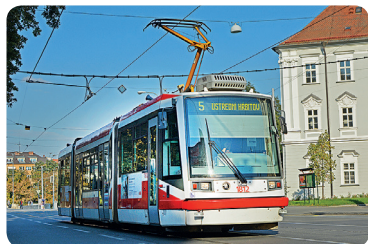
Tramvaj značky Škoda vyrobená v Plzni