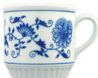
Český porcelán s cibulovým vzorem z Dubí