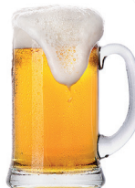
Česko je známé jako země piva. Nejproslulejší je plzeňský pivovar.