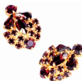
Český granát – minerál sytě červené barvy se zpracovává v Turnově.