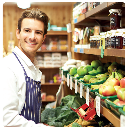
Služby (doprava, obchod, vzdělávání, zdravotnictví, cestovní ruch)