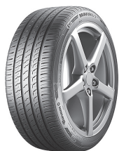
Pneumatiky značky Barum se vyrábí v Otrokovicích u Zlína.

Český průmysl má bohatou historii a tradici. Mnohé produkty, které se u nás vyrábí, mají světovou kvalitu a proslulost. Turisté si je kupují jako suvenýry, vyvážíme je do ostatních zemí Evropy i světa.