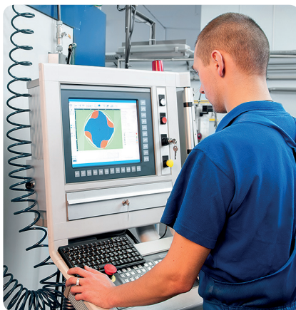
Zpracování materiálů a surovin (průmysl a stavebnictví, energetika)