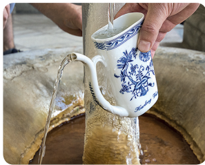
Minerální vody z Karlových Varů